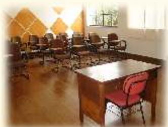
Sala Frei Leão