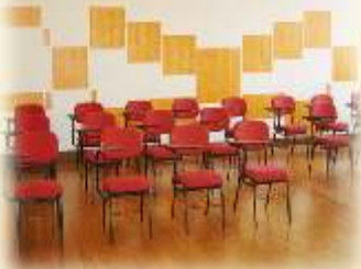
Sala Monte Alverne