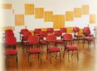
Sala Monte Alverne