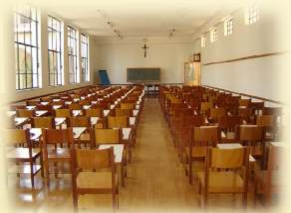
Sala da Paz

Uma sala para reuniões com até 70 participantes;