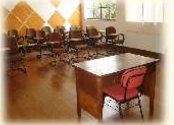
Sala Frei Leão