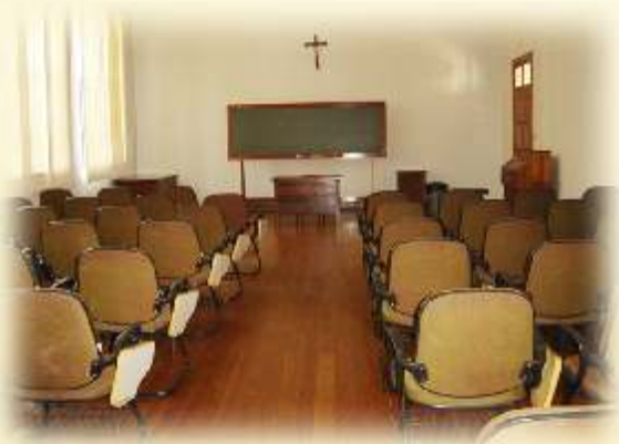
Sala Santa Clara

Uma sala para reuniões com até 70 participantes;