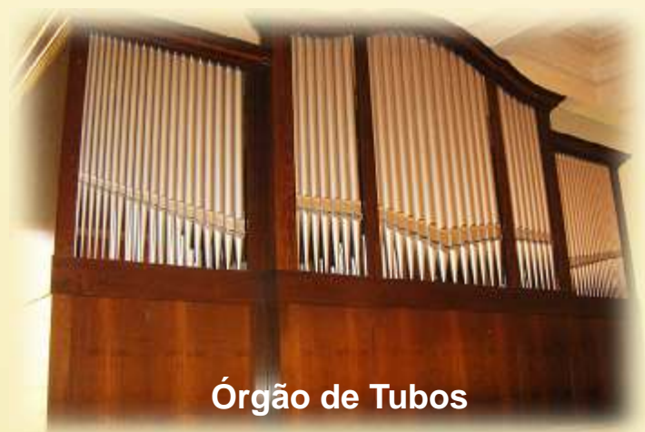
Órgão de Tubos

Em período letivo, celebrações de missas para a comunidade aos domingos às 09:00.